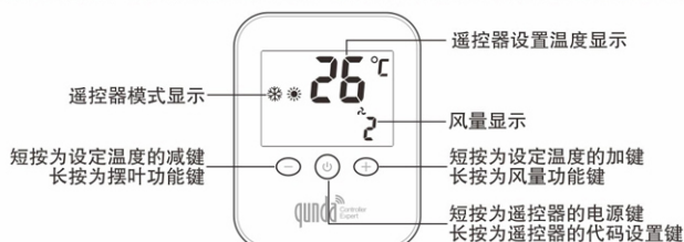
空调遥控器显示界面说明

注: 使用遥控器功能后, 液晶屏显示如下图, 如5秒内无按键自动恢复成温湿度计显示模式。